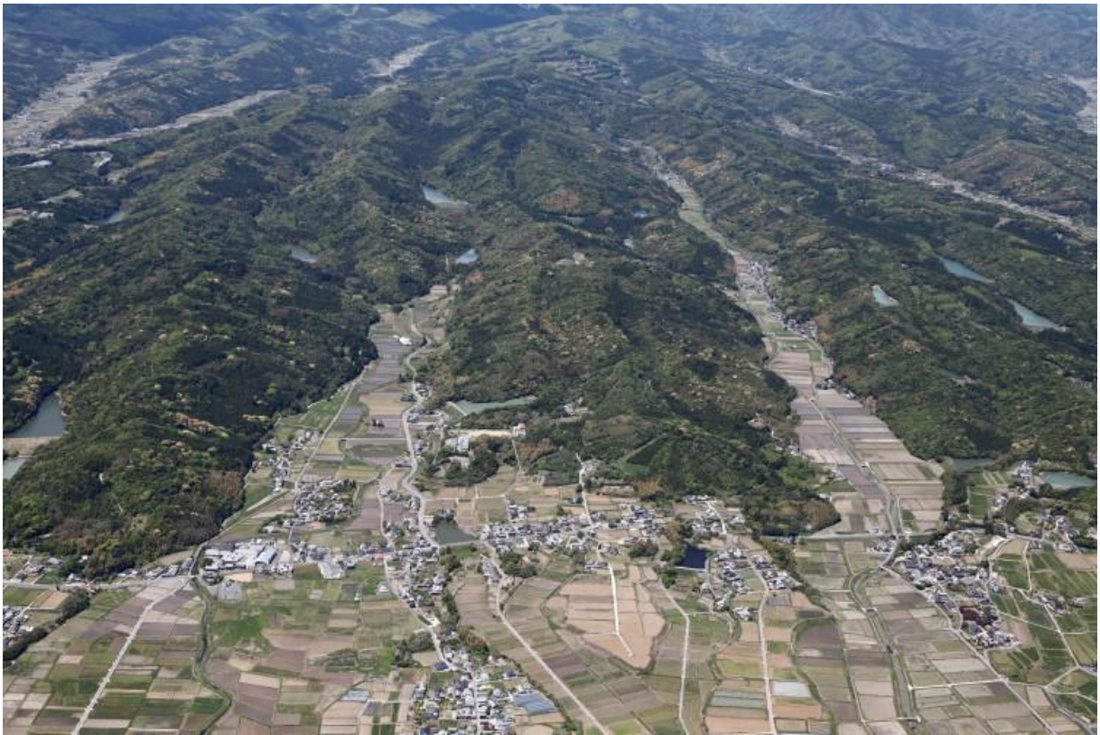
連携式ため池（国東町綱井地区）